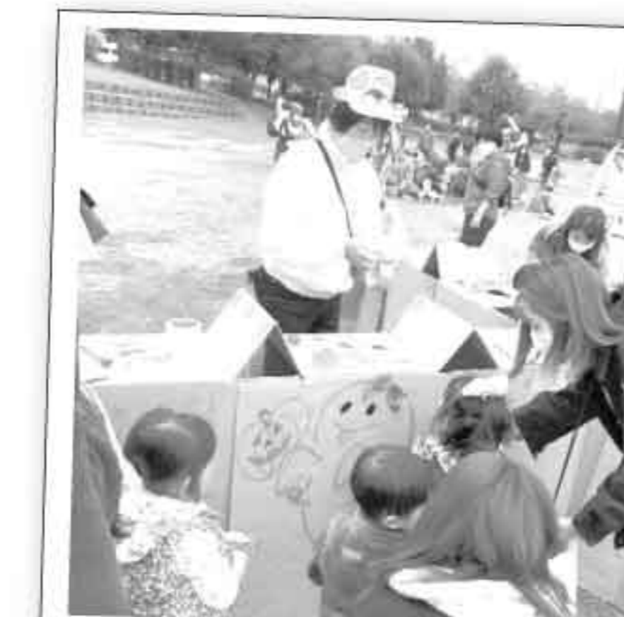
昨年のイベントの様子