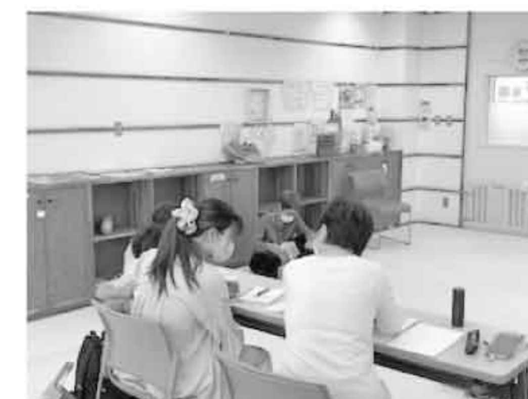
日本語を学ぶ人のために研修室の貸し出しも行っていきます。