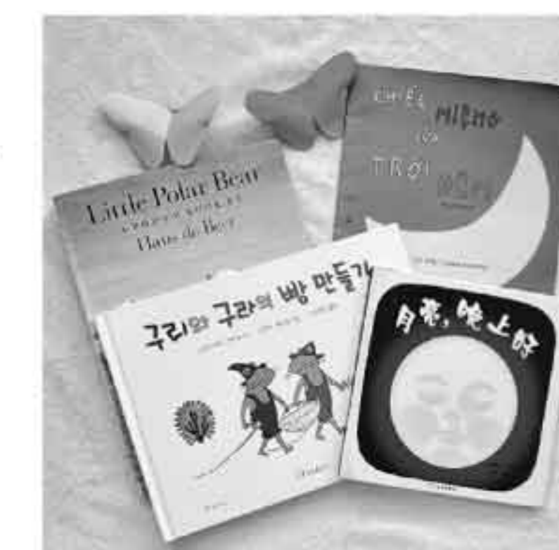
外国語の絵本があります