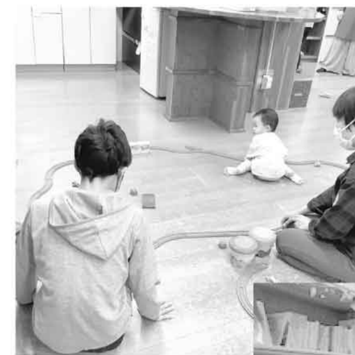
学生さんと赤ちゃんの ゆるやかな時間♪

ひろばで子どもと遊んだり、庭仕事やイラスト、おもちゃ作り など…にこてらすの中で自分の好きなことをいかして活躍して 下さっています。学生、祖父母世代の方やもちろん子育て真っ 最中の方もOK。いつでも募集中です♪